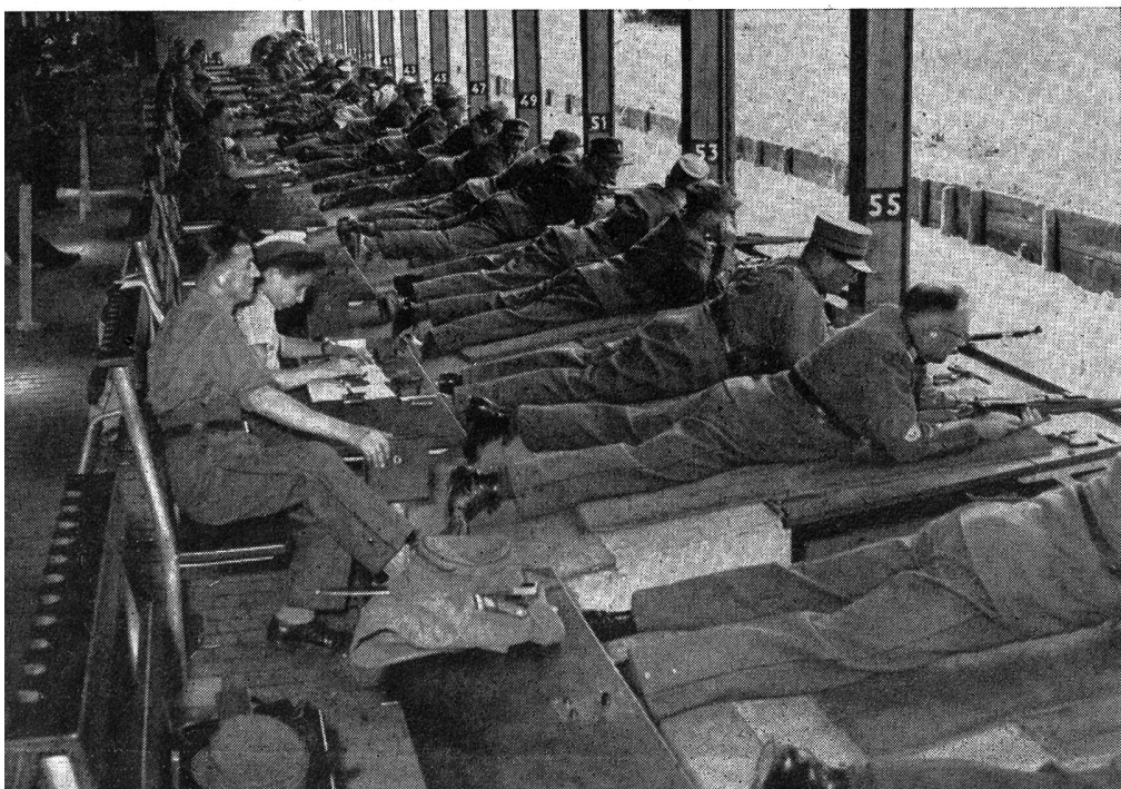
Wettkampf im Schießen.

Der Sonntag brachte mit den Gottesdiensten beider Konfessionen, dem Festzug durch die reichen Flaggen schmuck tragenden Straßen der Seeländer Metropole und dem vaterländischen Weiheakt im Stadion Gurzelen den Höhepunkt der SUT 1952. Der Berichterstatter hat einige Stimmen vernommen, die den Festzug als zu lang, zu pompös und als unnötig bezeichneten. Auch gab das Anstehen und die zeitraubende Ordnung des Festzuges zu Bemerkungen Anlaß. Der Berichterstatter hat den Festzug zweimal an sich vorbeiziehen lassen, das erste Mal kurz nach dem Abmarsch und das zweite Mal auf der Höhe der Ehrentribüne. Dieser Festzug, der einmal zu den SUT gehört, machte in seiner gut gewählten Gliederung, angeführt von der Bieler und Militär-Straßenpolizei und den Geschützen des Artillerievereins, einen ausgezeichneten, strammen und geschlossenen Eindruck. Sinnfällig kam den Ehrengästen wie den Abertausenden der Zuschauer, die in dichten Reihen die Straßen säumten, die geballte Kraft, die Wucht des zielstrebigem Wollens des Schweizerischen Unter-