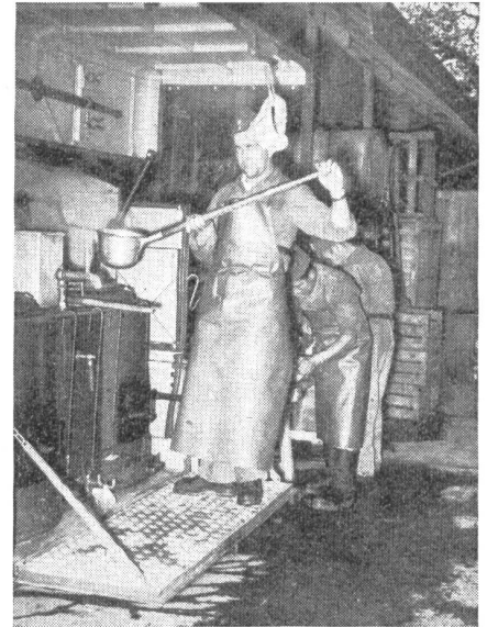
Von der Arbeit unserer Verpflegungsgruppen. Motorisierte Feldküche. Verschwunden sind die «romantischen Gulaschkanonen».