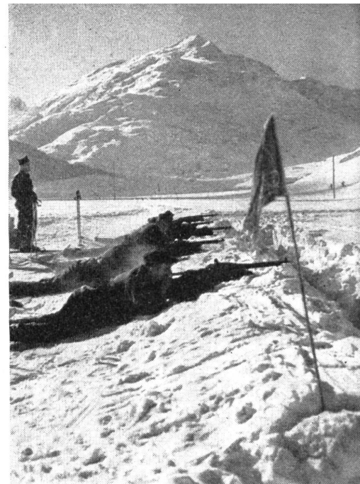
Skipatrouilleure im Schießtraining. Die Zusammenarbeit in der Patrouille muß immer wieder geübt werden. Aufnahme vom Skipatrouillenkurs der 8. Division in Andermatt.

Nun wird die Vorwärtsbewegung verstärkt, indem man das Gewicht mit einem Abstoß vom leicht gebeugten Standbein auf das vorschwingende Bein verlegt, wodurch das Gleiten verlängert werden kann. Als Folge des energischen Abstoßens und der Streckbewegung kommt es zu einem leichten Abheben des hinteren Skis. Die Streckung, unterstützt durch kräftige Mitarbeit des Rumpfes und energischen Stockeinsatz, setzt erst ein, wenn das Schwungbein am Standbein vorbeischiebt. Das Absetzen des hinteren Skis darf unbelastet schon vorher erfolgen. Während des Vorschwingens des hinteren Beines wird das Standbein durch leichtes Beugen für den nächsten Ab-