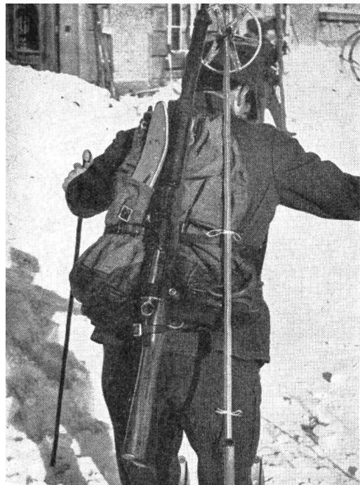
Die Ausrüstung des Patrouilleurs. Sturm- packung mit Reservestock und Reservespitze.

Wir betrachten die Bewegungen an Hand folgender Anleitung: