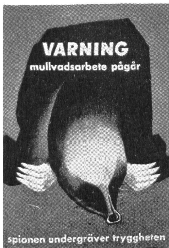
Achtung! Maulwurfsarbeiten im Gange. Demaskiere Spione und Saboteure! Spione untergraben die Sicherheit!

Die Vereinigung «Volk och Försvar» (Volk und Verteidigung), die, aus allen Schichten und Kreisen zusammengesetzt, sich in Schweden um die Aufklärung der Bevölkerung und die Unterstützung der Landesverteidigung verdient macht, hat eine Reihe eindringlicher Plakate drucken und verteilen lassen, die sich mit der Abwehr von Spionage und Sabotage befassen. Unser Bild zeigt eine Serie von vier Plakaten, die folgende Texte tragen: