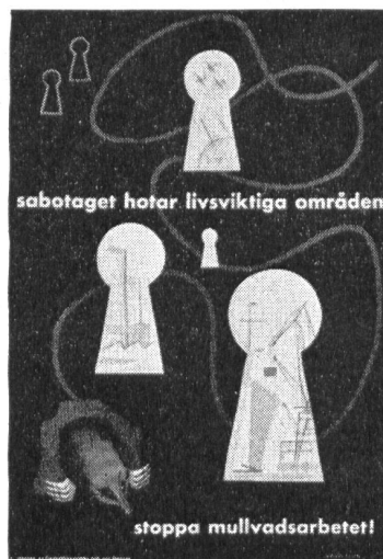
Die Sabotage bedroht lebenswichtige Gebiete, stopp der Maulwurfsarbeit!