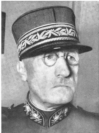
Oberstkorpskommandant Prisi †

Dieser Beschluß wird nach dem vom englischen Verteidigungsminister dem Unterhaus übermittelten Bericht weitreichende Auswirkungen auf die Verteidigungspolitik haben. Die Gewalt der Wasserstoffwaffen sei so groß, daß die Genauigkeit eines Bombardements aus der Luft von seiner Bedeutung verliere. Daher können Angriffe durch Flugzeuge in sehr großer Höhe und bei hoher Geschwindigkeit geführt werden. Zu diesem Zwecke soll eine moderne strategische Luftwaffe ausgebaut werden. Ueber die Auswirkungen der Wasserstoffwaffen sagt das Weißbuch: «Wenn solche Waffen verwendet werden sollten, so würden sie Menschen und Material in bisher nicht gekanntem Ausmaß zerstören. Eine in der Luft zur Detonation gebrachte H-Bombe würde ein weites Gebiet durch die Explosion und die Wärmestrahlung verwüsten. Bei einer Explosion auf der Erdoberfläche wären Detonationswirkungen und Hitze etwas geringer, aber es würden sich zusätzliche, sehr ernste Auswirkungen ergeben. Eine große Menge atomischer Teilchen würden in die Luft gesogen werden. Viel davon würde jedoch davongetragen und als radioaktiver ‚Ausfall‘ niedergehen. Die Wirkung auf die ohne Schutz im Gebiet der größten Konzentration des ‚Ausfalls‘ betroffenen Personen wäre tödlich. Ein grimmiger Kampf ums nackte Leben würde sich abspielen. Diese Tatsachen sollten nicht nur dem britischen Volke, sondern der ganzen Welt bekannt sein.»