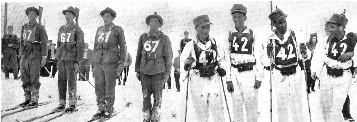
Sieger der Heerespatrouillen wurde das Grenzwachtkorps V mit Grenzwächter Bourbon, Gfr. Raussis, Gzw. Max und Gzw. Oguey. Photopreb.