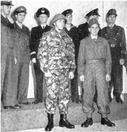
Die Uniformen der neuen westdeutschen Streitkräfte.

Unser Bild zeigt vorne v.l.n.r.: Armeesoldat in Gefechtsuniform und Armeesoldat in Arbeitskleidung. Hintere Reihe v.l.n.r.: Armeesergeant, Luftwaffenkapitän, Marineleutnant, Matrose, Maat und Luftwaffensoldat.