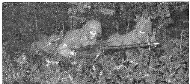
Zwei vom Stoßtrupp des nächtlichen Handstreichs.

grauen zum überqueren des Wassers verwendet werden sollte. Nach Mitternacht setzte sich dann mit vorgängigem Ablenkungsmanöver überraschend eine durch das reißende Wasser sich durchkämpfende feindliche Patrouille unter den Felsen in guter Deckung fest. Gut ausgerüstete Sanitätler waren aktiv tätig und Militärküchenchefs bereiteten nach Anordnungen von Fourieren gefechtsmäßig die Verpflegung zu, welche unter taktischer Annahme dem Kampfabschnitt zugeführt wurde. Uebermittlungstruppen besorgten mit