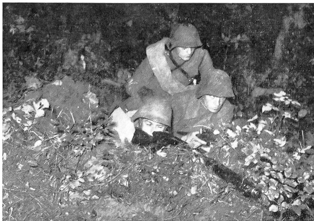
Der Lmg-Trupp der Vorpostierung eröffnet beim Aufleuchten der Rakete das Feuer auf den erkannten Gegner.

legungen ableiten zu können als einen kleinen Teil aller auftauchenden Ausbildungsfragen, die sich eben aus vielen Details zusammensetzen. Bei der Felddienstübung I handelte es sich darum, im Kp.-Verband einen dargestellten aktiven Feind im Anmarsch abzufangen. Sie begann mit einer Vorpostenübung, um zu beobachten, aufzuklären, zu melden und nach Feindkontakt mit ständigen Gegenangriffen, Umgruppierungen und allen möglichen Schikanen sperrend den angreifenden Feind zu vernichten. Nach Eindunkeln kämpfendes Zurückgehen mit Bezeichnung von Verwundeten und Toten als Loslösung vom Feind und Uebergang per Ponton in eine Aufnahmestelle herwärts des Sees mit Errichtung von Abwehrstützpunkten. Die anschließenden Beobachtungs-, Patrouillen- und Sperraufträge dauerten bis gegen Mitternacht. Dann Bezug einer gesicherten Unterkunft mit vorbereiteter Verpflegung und kurzer Nachtruhe. Nächtliche Durchführung eines Handstreiches jenseits des Sees durch Feuerüberfall im Leuchtraketenlicht, um ein festgestelltes, bemanntes feindliches Materialdepot zu zerstören. Nach Tagesanbruch eine Ueberraschung für den Verteidiger, indem starke Fallschirmdetachements als Störer und Spitze eines feindlichen Flankenangriffs die Stützpunkte zu überrumpeln versuchten. Hier zeigte es sich, ob die Stützpunkt-Kdt. bezüglich Beobachtung, Aufklärung, Feuerbefehlen und allen