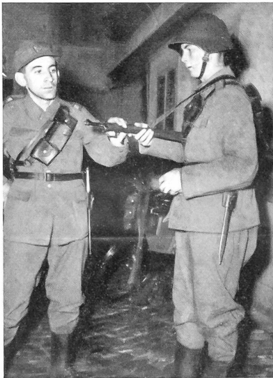
Aus einer Radfahrer-Rekrutenschule «Wie geht's?» Fürsorglich erkundigt sich der Gruppenführer nach dem Zustand seiner Leute und ihrer Ausrüstung.

Suisse nennt. Hindernisse besonderer Art stellen sich hier den Rekruten in den Weg: Gemächlich ziehen größere und kleinere Kuhherden auf die Weideplätze zu Füßen des Gonzen und Alvier hinaus. Nach Sargans wird der Wind zum willkommenen Verbündeten und stößt die allmählich ermüdeten «Giganten im feldgrauen Dreß» gegen Landquart hinauf, ans Tor des Prättigaus. Noch 30 Kilometer und 700 Meter Höhendifferenz sind zu überwinden. Fast bricht die Sonne durch die gelichtete Wolkendecke. In forschem Tempo eilen die Fahrer nach aufwärts. Doch bleibt der gefürchtete Stich zwischen Küblis und Saas. Die «Bergspezialisten» wetzen ihre Klingen. Dann heißt's aber bald einmal für alle absitzen und «rudern». Gnädig bleibt jetzt die Sonne versteckt. Die Kompanien haben sich wieder gut formiert und fahren mit viertelstündigem Vorsprung auf die Marschtabelle durchs «Etappenziel». Die Rekruten haben die erste große Probe bestanden.