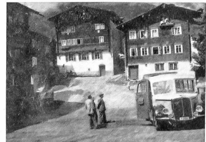
Hier ein Ausschnitt des ehrwürdigen Dorfplatzes von Ernen, einer fortschrittlichen Gemeinde im Oberwallis, von der in unserem Bericht ausführlich die Rede ist.

Dem Sterben der Bergdörfer kann ohne fremde Hilfe kein Einhalt mehr geboten