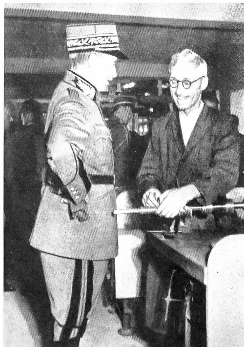
General Guisan besucht den «unbekannten Soldaten hinter der Front».

Der General sprach: «Kein Truppenführer kann und darf die sozialen Probleme vernachlässigen. Der Oberbefehlshaber kann seine Funktionen in ihrer wirklichen Gesamtheit nur dann erfüllen, wenn er sich nicht bloß um die wirtschaftlichen Fragen kümmert, sondern auch um die Wirtschaft des Landes . . . so fuhr ich z. B. nach Genf, Winterthur und Baden, um die Arbeiter — die ja alle meine Soldaten waren — in ihren zivilen Verhältnissen aufzusuchen.» (Photo aus «Cœur à cœur»)