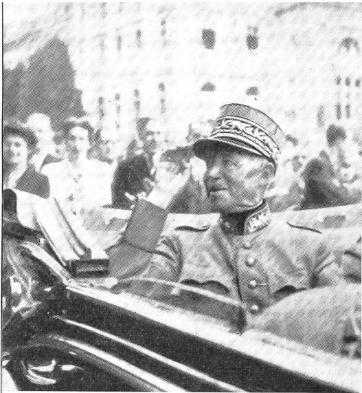
General Guisan verabschiedet sich am 20. Juni 1945 vor dem Parlamentsgebäude.

Der General sprach: «Mein Auftrag ist erfüllt. Ich trete ins Glied zurück und bleibe zur Verfügung meines Landes.»