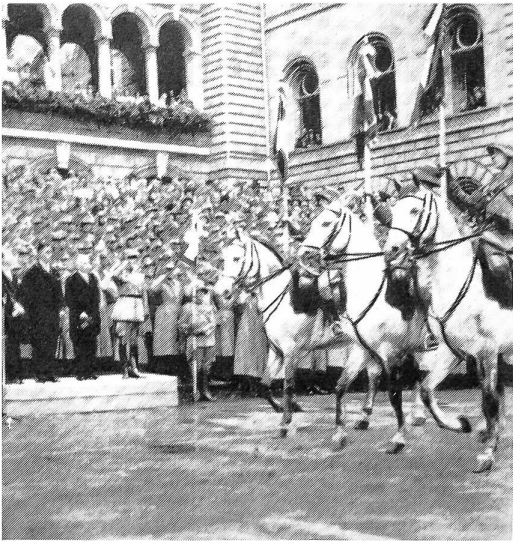
Fahnenehrung in Bern, 20. Aug. 1945. Der General sprach: «Euer General tritt ins Glied zurück, aber die Armee bleibt in Bereitschaft, und das ist es, was zählt.»

Tatsache ist aber vielleicht noch mehr als bloßer Ausdruck der Sympathie für die Volksverbundenheit, die Tüchtigkeit und das Ansehen des ersten Soldaten, es bedeutet auch Dankbarkeit an den General und ist zugleich ein Symbol jedes einzelnen Offiziers, Unteroffiziers und Soldaten, der mutig, ruhig und treu während sechs Jahren seine Pflicht der Heimat gegenüber erfüllt hat. Das Bild des Generals ist aber auch ein Zeichen der Einheit und Geschlossenheit unserer Armee während des vergangenen Aktivdienstes und sprechender Zeuge der Verbundenheit zwischen Volk und Armee. Möge das Bild des Generals dem Schweizervolke eine stetige Mahnung zur Eintracht, zur Treue und Hingabe an das Vaterland sein. General Guisan wird aber mit einem warmen Glanz in die Schweizergeschichte eingehen. «Il a mérité sa patrie — Er hat sich um das Vaterland verdient gemacht.»