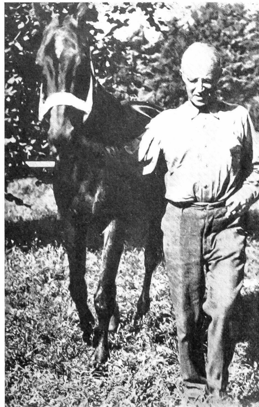
«Verte-Rive» bei Pully.

Die Leser unserer Zeitung möchten wir auf die Stiftung Militärbibliothek Basel (Schönbeinstraße 20, Basel, Tel. (061) 247827), deren über 30000 Bände zur unentgeltlichen Benützung zur Verfügung stehen, hinweisen.