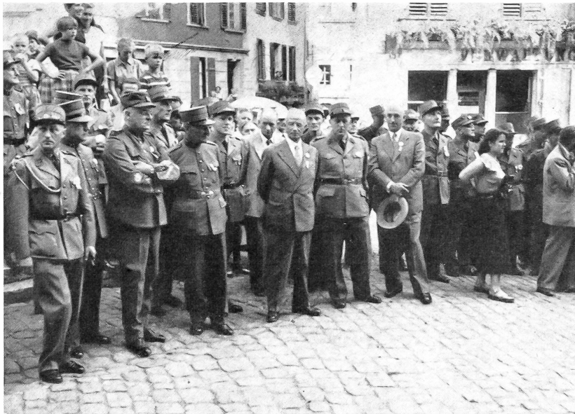
SUT 1952 in Biel.

Der General inmitten des Zentralkomitees und des Organisations-Komitees