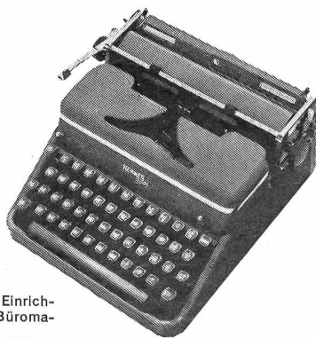
Hermes 2000 die Luxusportable mit den Einrichtungen einer modernen Büromaschine Fr. 470.-

Paillard SA. mit Werken in Yverdon und Ste-Croix ist seit 140 Jahren weltbekannt für ihre Leistungen auf dem Gebiet der Präzisionsmechanik. Die von ihr entwickelten HERMES-Schreibmaschinen tragen das Kennzeichen bester schweizerischer Qualitätsarbeit.