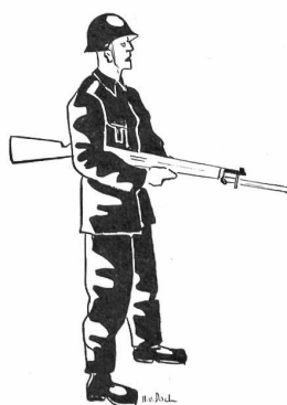
TRAGART DER WAFFE ALS WACHE