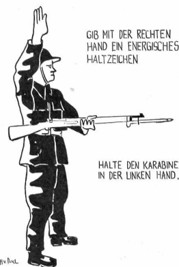
ANHALTEN VON FAHRZEUGEN ALS WACHE!