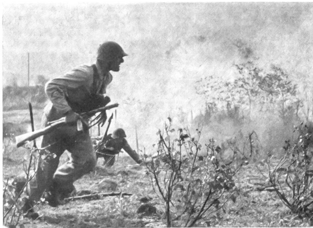
Die Grenadiere müssen auch lernen, wie der Angriff mit Unterstützung der schweren Waffen der Infanterie an die Ortschaft herangetragen wird, wo sie dann im harten Ringen den Kampf von Haus zu Haus aufnehmen.