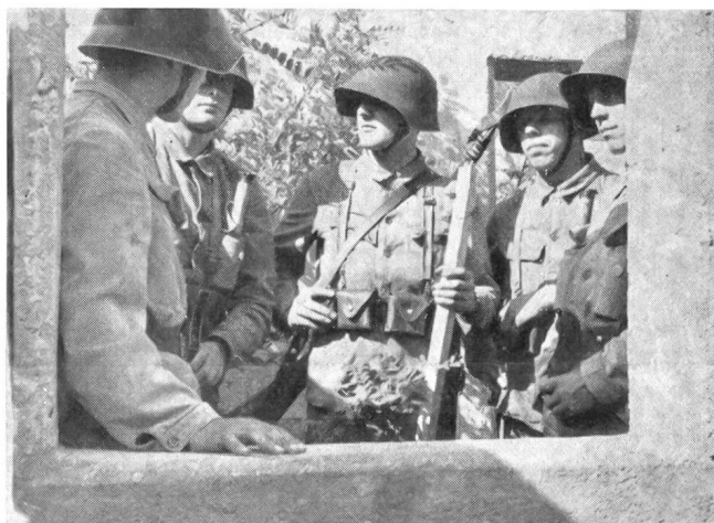
In der Ausbildungsphase, die dem Zusammenspiel der Mittel und Trupps im Ortskampf gewidmet ist, gilt es, verschiedene Situationen unter wechselnden Annahmen immer wieder durchzuspielen. Im Ortskampf muß von Haus zu Haus aufgebaut werden. Dieses Bild zeigt die Befehlsausgabe des Gruppenführers an seine Truppführer in einem kleinen Detachement.