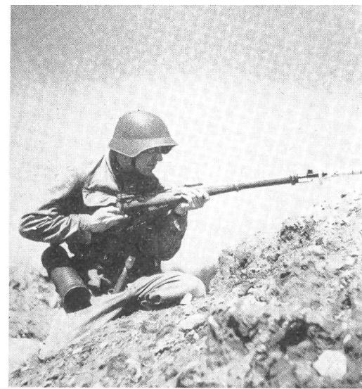
Die Panzerabwehr mit der Panzer-Wurfgranate, die 1950 in das außerdienstliche Arbeitsprogramm des SUOV aufgenommen wurde, ist in allen Unteroffiziersvereinen zu einer beliebten Disziplin geworden. Diese Aufnahme wurde anlässlich der SUT-Vorbereitungen in einer der 136 Sektionen des SUOV aufgenommen.

Die Kampfgruppenführung am Sandkasten ist eine der wertvollsten Disziplinen außerdienstlicher Tätigkeit des Schweizerischen Unteroffiziersverbandes. Sie stellt die Unteroffiziere, entsprechend ihrer Waffengattung und Gradfunktion, vor eine taktische Situation. Die Übungen umfassen die Führung von kleinen Verbänden, wie Gruppe, Patrouille, gemischte Detachements in höchstens Zugstärke. Der Konkurrent erhält auf dem Aufgabenbüro 12 Minuten vor Beginn der Prüfung einen verschlossenen Umschlag, auf welchem die Sandkastenummer angegeben ist, die Ausgangslage, der erste Auftrag und die Aufgabennummer. Er begibt sich hierauf in das Vorbereitungszimmer, wo er den Umschlag öffnen darf und rund 10 Minuten Zeit hat, sich an Hand eines Orientierungs-Sandkastens das Gelände und die allgemeine Lage einzuprägen und den ersten Auftrag zu überlegen. Genau auf die vorgesehene Prüfungszeit steht er vor seinem Prüfungszimmer, um sich auf Abruf beim Kampfrichter zu