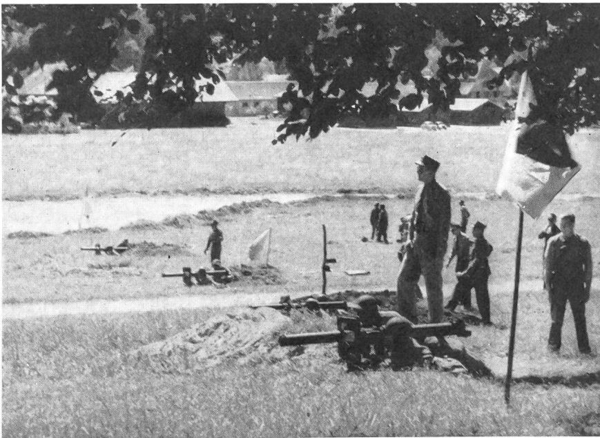
Irgendwo im Lande bei einem Unteroffiziersverein, der am Samstagnachmittag unter Leitung tüchtiger Offiziere zum Raketenrohrschießen auf fahrende Panzertruppen angetreten ist. Es sind rund 40 Mann erschienen, denen vier Raketenrohre und Instruktoren zur Verfügung stehen. Auf diese Weise haben sich die Sektionen aller Landesteile auf die SUT vorbereitet.

Die auch für die Zuschauer spektakulärste Disziplin ist die Panzerabwehr . Die Förderung des technischen Könnens in der Panzerabwehr mit der Panzer-Wurfgranate und dem Raketenrohr und die Ausbildung zum richtigen Verhalten in der Panzerabwehr sind der Hauptzweck dieser Disziplin. Für diese wichtige, Treffsicherheit und Reaktion fördernde Disziplin werden über 2000 Wettkämpfer erwartet. Mit