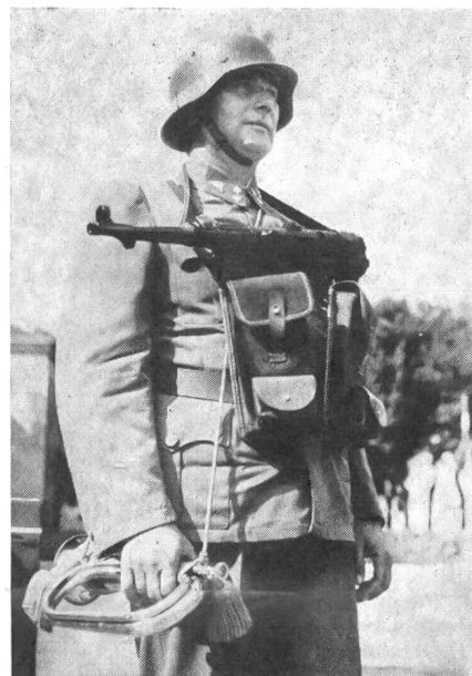
Oesterreichischer Trompeter-Uof. mit Maschinenpistole.

Der österreichische Bundespräsident figuriert zusammen mit den für das Bundesheer zuständigen Mitgliedern der Regierung als Oberbefehlshaber. Der Aufbau der Armee wird von den unmittelbaren Vorgesetzten des Amtes für Landesverteidigung, dem Bundeskanzler und dem Vizekanzler geleitet. Durch diese Lösung bleibt der Einfluß beider Parteien, der OeVP und der Sozialdemokraten, auf die Armee gewahrt. Erst die Zukunft wird zeigen, ob dieser Kompromiß für das Bundesheer von gutem ist. Aus eigener Beobachtung kann gesagt werden, daß die Einheiten der Gendarmerie in den letzten Jahren einen guten Eindruck