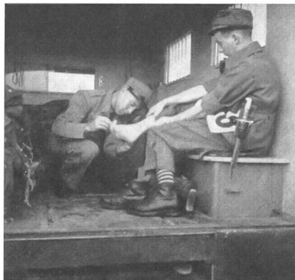
Am Waffenlauf ist mancher froh um das fahrende Krankenzimmer des MSV im Ambulanzwagen.

Die Präsidentin des Verbandes schweizerischer Militärfahrerinnen meldet sich zum Wort und führt aus: «Auch unser Verband setzt sich die gleichen Ziele, wie sie mein Vorredner schilderte. Unsere Arbeit aber ist zweierlei, und zwar sehr verschiedener Art. Wir müssen den Gang des Motors kennen, Pannen beheben können, Parkdienst leisten, in jedem Gelände und bei jeder Witterung sichere Fahrerinnen sein, Arbeiten, die nicht ohne weiteres der Frau gegeben sind und deshalb ständiges Ueben bedingen. Wir müssen uns auch in unbekanntem Gelände mit Karte und Kompaß zurecht finden können und uns nicht zuletzt in eine uns ungewohnte militärische Ordnung einfügen. Dann haben wir aber auch mit Verwundeten zu tun. Wir haben sie aufzunehmen, kürzere oder längere Zeit zu transportieren, sie manchmal zu pflegen und ihnen oft auch die erste Hilfe zu leisten. Und diese Aufgabe ist uns wesensnahe, denn welche Frau wäre nicht die erste, wenn es gilt Not zu lindern. Es ist uns deshalb ein inneres Bedürfnis, die erste Hilfeleistung an Verwundete zu beherrschen. Wir sind froh, daß vor kurzem der Schweizerische Militär-Sanitäts-Verein seine Statuten, nach denen bisher nur männliche Angehörige der Armee Mitglieder sein konnten, in dem Sinne abgeändert hat, daß nun auch FHD mitarbeiten können.» Hier