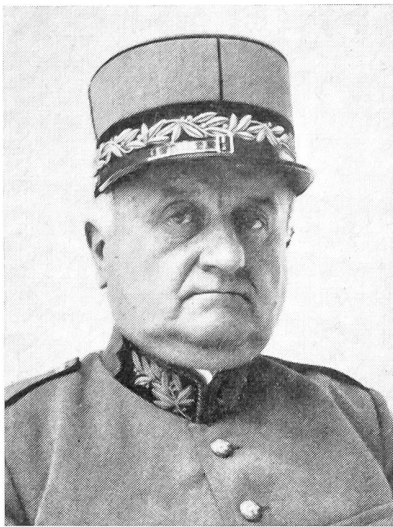
Eugen Bircher †