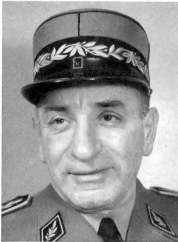
Der Kommandant der Flugplätze: