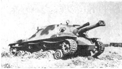
Ein ausländisches Modell eines gepanzerten Selbstfahrgeschützes.