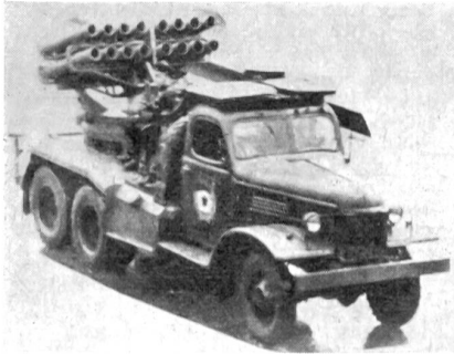
Ein ausländisches Modell eines Mehrfach-Raketenwerfers.