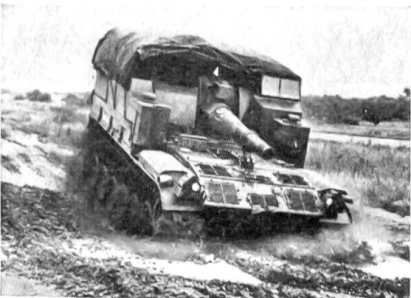
Ein ausländisches Modell eines nichtgepanzerten Selbstfahrgeschützes.

Von mindestens ebenso großem Interesse dürfte aber die Frage sein, was unsere Artillerie bereits heute, also mit ihren bei der Truppe wirklich vorhandenen Mitteln unter Einschluß geringfügiger Abänderungen, in teilweiser Erfüllung der aufgestellten Forderungen unternimmt.