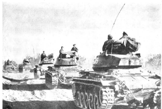
Zusammenarbeit Panzer und Infanterie im Gefecht.