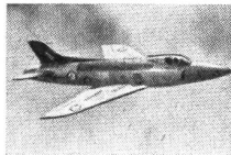
GROSSBRITANNIEN SWIFT (Supermarine)

Ursprünglich als Jäger der Royal Air Force entwickelt, wird der Swift heute als Jagd-aufklärer und Jabo (Jagdbomber) eingesetzt. Erkennungsmerkmale: Von vorne: Tiefdecker, Höhensteuer in positiver V-Stellung, stark absteigende Lufteintrittsöffnungen auf den Seiten. Von der Seite: Geschoßförmiger Rumpf, kleines, stark vorgesetztes Seitensteuer mit kurzem Grat. Von unten: Vordere Flügelkante sehr gefeilt, dünne Rumpfspitze, absteigende Luftläufe, Höhensteuer gegenüber der Düsenöffnung vorgesetzt.