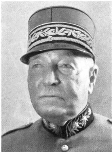
Oberstkorpskommandant Ulrich Wille Der erste Ausbildungschef der Armee

Das Amt eines Ausbildungschefs der Armee ist kurz vor Ausbruch des zweiten Weltkrieges durch eine Novelle vom 22. Juni 1939 zum Bundesgesetz über die Militärorganisation geschaffen worden. Für diese Neuerung waren zwei Überlegungen maßgebend; einerseits ging es darum, die Zahl der direkt dem Chef des Eidg. Militärdepartements unterstehenden Abteilungen — es waren bisher deren 15 gewesen — auf ein angemessenes Maß herabzusetzen, und andererseits sollte damit in der ganzen Armee die Einheitlichkeit der Ausbildungs- und Führungsgrundsätze, insbesondere im Hinblick auf den Kampf der verbundenen Waffen, sichergestellt werden. Aus diesen Gründen wurden die Waffenabteilungen des Eidg. Militärdepartements in einer besonderen Gruppe für Ausbildung zusammengefaßt, die unter der Leitung des Ausbildungschefs stand. Der unlängst verstorbene Oberstkorpskommandant Wille wurde bei Beginn des Aktivdienstes zum ersten Ausbildungschef unserer Armee eingesetzt.