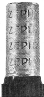
Stange mit Bakelitfuß Fr. 1.—

Ist die Haut auch sehr empfindlich mit ZEPHYR geht es schnell und gründlich!