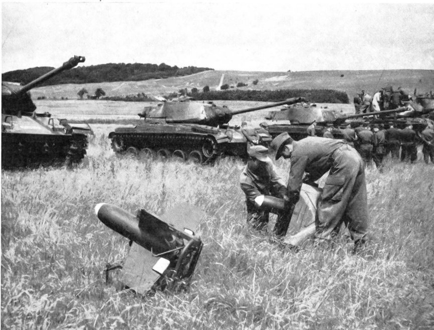
Raketen jagen Panzer. Französische Raketen vom Typ SS 10. Die Reichweite der 15 Kiloschweren Raketen beträgt bis zu 1600 Meter, bei einer Geschwindigkeit von etwa 360 Stundenkilometern. Ein Knopfdruck des Kanoniers, der bis zu 150 Meter von der Rakete entfernt sein kann, löst den Abschub aus.

«Der Drill ist», antwortete der Oberst mit ernstem Gesicht, «unbedingt erforderlich, um die Truppe jederzeit bei der Kandare zu halten. Im Exerzierreglement der Roten Armee steht zwar neuerdings die Weisung, daß dem Paradeschritt sowie natürlich auch dem Präsentiergriff keine allzu große Bedeutung mehr zugemessen werden solle. Mit anderen Worten: Der Verteidigungsminister will es nicht haben, daß mit solchen und ähnlichen Nebensächlichkeiten viel Zeit verlorengeht. Der Begriff jener Weisung ist indes dehnbar. Jedem Einheitskommandanten steht ein gewisser Spielraum für sein eigenes Ermessen zur Verfügung. Und das ist gut so. Nicht nur das geregelte und enge Zusammenleben in der Kaserne schweißt die jungen Leute zu einer festen Gemeinschaft zusammen, son-