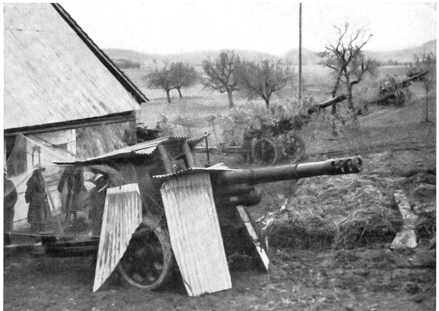
Schwere Haubitzen-Batterie in Stellung

Baujahr 1954 Gewicht 24,5 t Motorstärke 500 PS Max. Geschw. 55 km/h Panzerung 12 mm