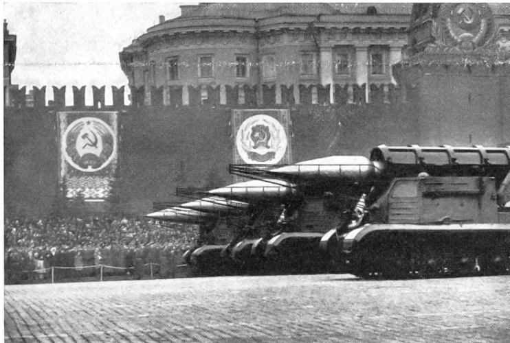
Panzerfeldraketenwerfer für un gelenkte Boden-Boden Raketen Typ 2 mit Feststofftreibsatz, Raketenlänge 9,5 m, 5000 kg Abschlußgewicht, 1200 kg Sprengstoff, aufwärts schwenkbares Mantelrohr mit Kälteschutzeinrichtung, 40 bis 50 km Reichweite, Fahrgestell des Panzer-typs JS III. (Aus dem großen Bild-Teil von «Landesverteidigung am Wendepunkt»)