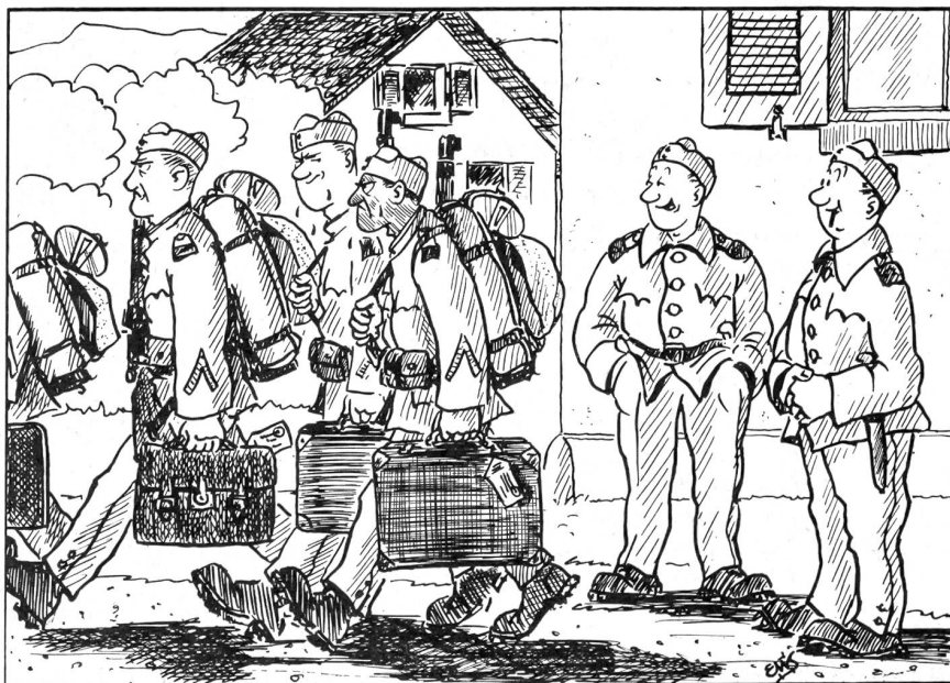
Köfferli-Türgg: «...Woane hauets-es?» «Is alt Kantonement z'rugg und dete iri Köfferli heischicke, wo bi de Dislokation uf mene Fourgon g'funde worde sind!»