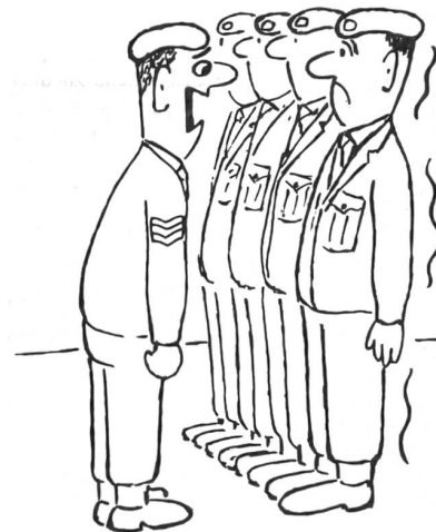
«Wer gab Ihnen Erlaubnis zu zittern?!» (Aus «Soldier»)