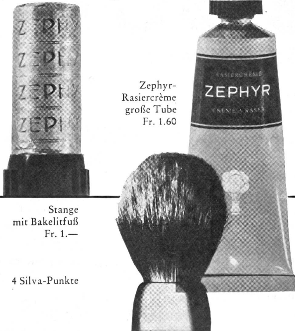
Zephyr- Rasiercreme große Tube Fr. 1.60

Ist die Haut auch sehr empfindlich mit ZEPHYR geht es schnell und gründlich!