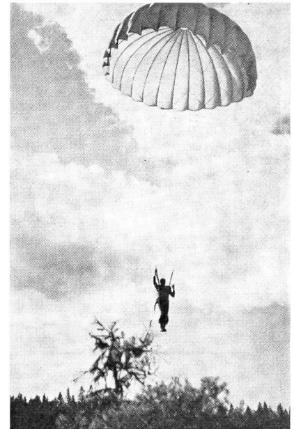
Erstmals hängt hier der junge Fallschirmjäger zwischen Himmel und Erde, und es braucht einiges Geschick, gut zu landen, Bäumen und anderen Hindernissen auszuweichen.

Wert und Nutzen des Drills in Lagen, wo der Kopf stillesteht, können kaum überschätzt werden.