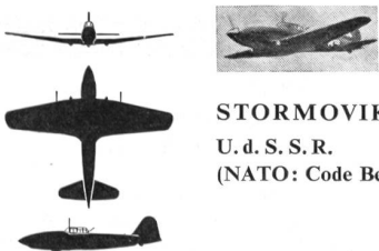
STORMOVIK U. d. S. S. R. (NATO: Code Beast)

Der Stormovik, ursprunglich ein Jabo (Jagdbomber), durfte heute noch fur Erdkampfaufgaben eingesetzt werden.