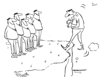
«Na also, Leute, auf dieses frohe Lächeln habe ich die ganze Zeit gewartet!» (Aus «Soldier»)