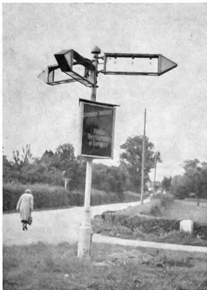
Vor zwanzig Jahren

Sehr gut und von den Zuschauern nach verschiedenen übereinstimmenden Meldun-