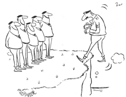
«Na also, Leute, auf dieses frohe Lächeln habe ich die ganze Zeit gewartet!» (Aus «Soldier»)