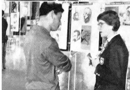
Bilder von oben nach unten:

Eines der 15 in der Stadt Wien errichteten Informationszentren, die regen Zuspruch erhielten und oft bis tief in die Nacht hinein von diskutierenden Gruppen umstellt waren