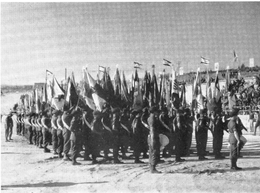
Die Ehrenzeichen der israelischen Kampfeinheiten

wird, gegen welche Entwicklung jede westliche Intervention ein Schwimmen im geschichtlichen Hinterwasser bedeutet, ist denkbar ungünstig . Die Hauptstadt Jerusalem liegt an der äußersten Spitze eines schmalen Korridors, die Großmächte Tel Aviv und Haifa liegen unter dem Wirkungsbereich gegnerischer Artillerie, Mittelisrael ist ein schmaler Korridor von 20 Kilometern Breite zwischen Jordanien und dem Meer, Galiläa bildet eine sackartige Ausbuchtung zwischen Libanon und Syrien. Die Grenzen mit den Gegnern haben eine Ausdehnung von 1000 Kilometern. Innerhalb des Landes befinden sich ungefähr 140 000 Araber, meistens in geschlossenen Siedelungen, welche in einem Entscheidungskampfe sicher nicht auf Israels Seite stehen werden. Nur mit Beklemmung können wir an dieses 2-Millionen-Volk denken, welches über keine Oelquellen und über keinen Suezkanal verfügt, dementsprechend für die Große Politik nur Objekt und nicht Subjekt sein kann. Das Rad der Geschichte droht immer mehr über Israel hinwegzugehen — doch darauf darf man sich verlassen: auch im schlimmsten Falle wird dieses Rad nicht mühelos über die Mutigen und Tapferen an der Ostküste des Mittelmeeres rollen.