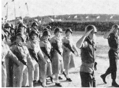
Funkerinnen beim Vorbeimarsch

derum ist sehr «beweglich» organisiert. Relativ kleine Kampfgruppen werden je nach Aufgabe zu mittleren Kampfverbänden zusammengestellt. (Der Sinaifeldzug war also nicht etwa das Werk von Divisionen, sondern von eher kleinen, aber zahlreichen Verbänden.)