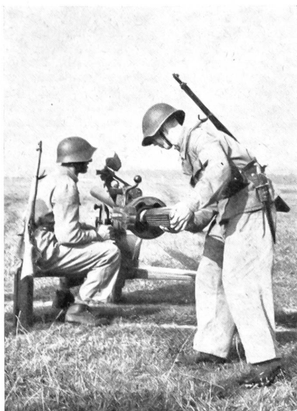
Unser Bild zeigt das Einschleiben des Geschosses in die BAT.

Erstmals wurden Wehrmänner in der Handhabung und im feldmäßigen Einsatz des neuen, rückstoßfreien Panzerabwehrgeschützes Typ BAT (Provenienz: USA) ausgebildet. Das Geschütz besitzt Treffsicherheit auf 1500 bis 2000 m Distanz und wiegt rund 250 kg.