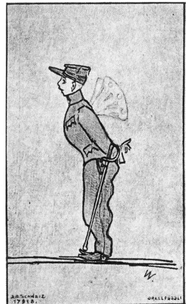
Ein liebes Kerlchen

Aber auch hier muß die Planung über die Durchführung dieses Kampfes vorausgehen. Sie muß heute schon beginnen, wenn Ihre Bemühungen bis Ende des nächsten Jahres von Erfolg gekrönt sein sollen. Gerade die Wintermonate sind die beste Zeit für diese