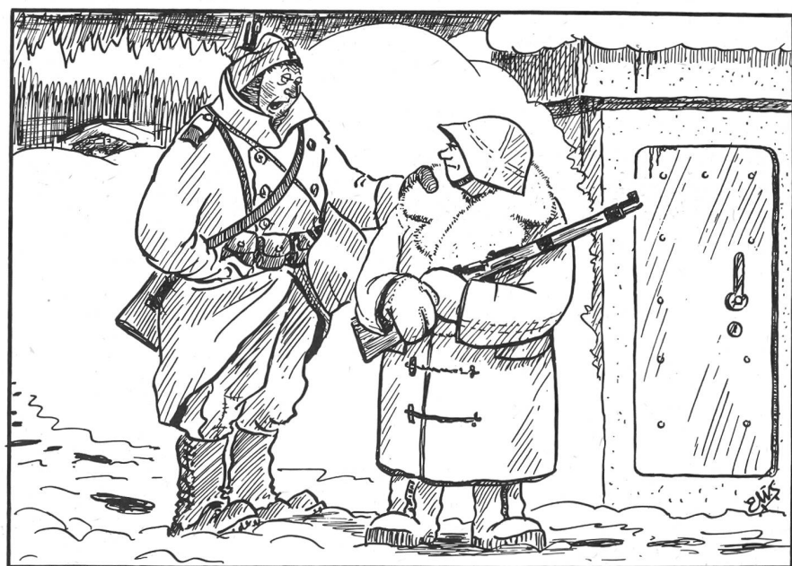
«Wohl-wohl — d Zytten-ändern in dr Brigada in Sacha Kleidig — händer-all dera Mäntel gfaßt oder ischt der am Montgomery sina?»