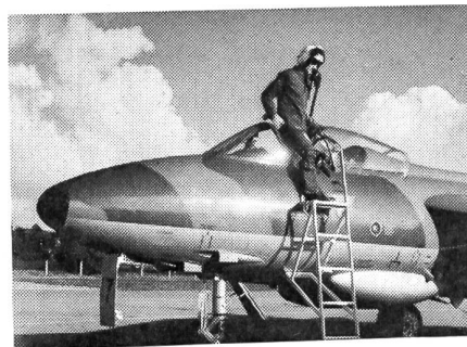
Ein HUNTER-Pilot kehrt von seinem Flug zurück

Die Type HAWKER-«HUNTER» F6 ist zurzeit das schnellste Strahlflugzeug in unserer Flugwaffe. Als einsitziger Jäger und Jagdbomber besitzt er ein Rolls-Royce-Turbostrahltriebwerk Type AVON mit einer Schubleistung von 4530 kgp. Die Höchstgeschwindigkeit des HUNTER liegt bei 1170 km pro Stunde. Im Sturzflug können Überschallgeschwindigkeiten erreicht werden.