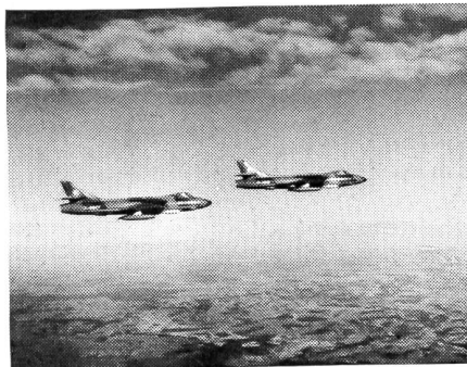
Eine HUNTER-Zweierpatrouille über dem schweizerischen Mittelland

Mit der ersten fliegerischen Konkurrenz – dem Bombenabwurf aus Vampire- und Venom-Kampfflugzeugen – wurde etwa 40 Minuten später begonnen als programmgemäß vorgesehen, da die Organisatoren genötigt waren, die Startzeit zu dieser Disziplin zufolge Verschlechterung der Wetterlage hinauszuschieben.