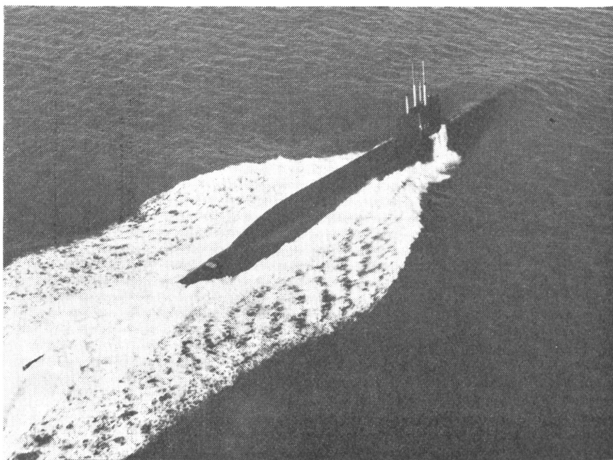
Ein Polaris-U-Boot auf einer Uebungsfahrt vor dem Tauchen