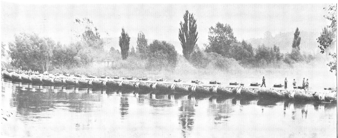
Die fertige 50-Tonnen-Schlauchboot-Brücke