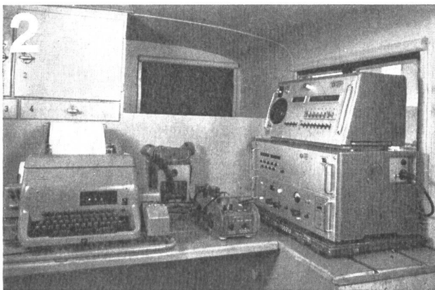
Zellweger AG., Uster/ZH Apparate- und Maschinenfabriken Uster