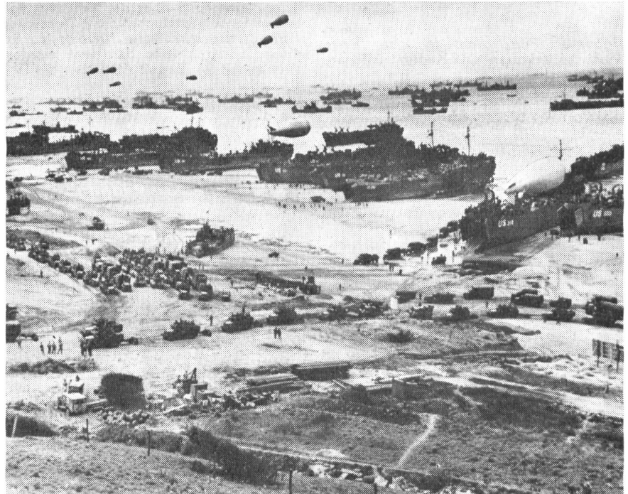
Normandie, 6. Juni 1944.