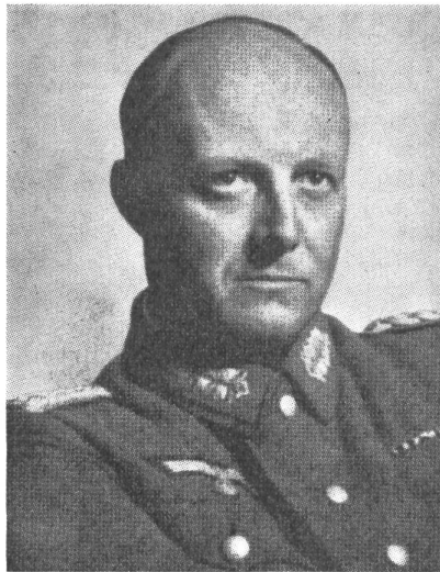
General Henning von Tresckow 10. Januar 1901–21. Juli 1944

erster Linie durch die erklärten Antidemokraten. Der Weimarer Staat scheiterte an den Ungeduldrigen, denen parlamentarische und rechtsstaatliche Verfahrensweisen zu umständlich erscheinen; an den Menschenverächtern, die Freiheit für Schwäche halten; den Trägern, die sich am Privaten genügen lassen; den Opportunisten, die Augen und Ohren vor dem Unrecht verschließen; an den sogenannten Idealisten, deren lebensferne Staats- und Gesellschaftsvorstellungen sie nie erfüllen können; und nicht zuletzt an den Reaktionären, die verlorene Autoritäten wiederherstellen möchten.