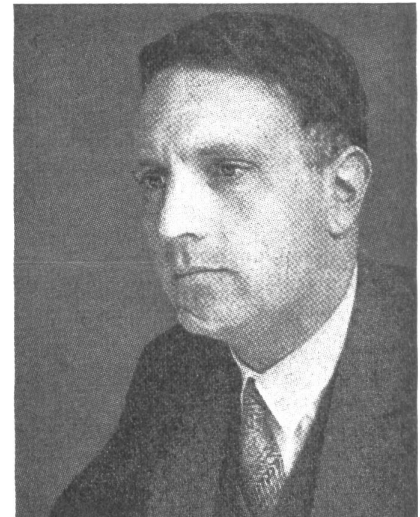
Dr. Theodor Haubach 15. September 1896–23. Januar 1945