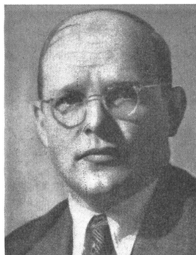
Dietrich Bonhoeffer 4. Februar 1906–9. April 1945