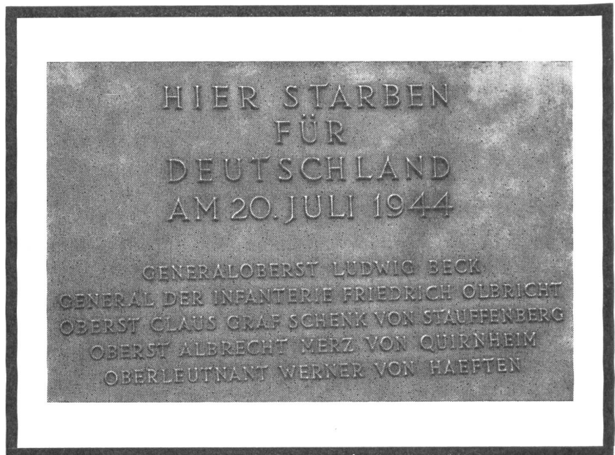
Gedenktafel mit den Namen der im Hof des einstigen OKW an der Bendlerstraße zu Berlin erschossenen Offiziere

Der Bestand freiheitlicher Ordnung läßt sich nicht garantieren; sie lebt und entwickelt sich mit der Intensität des Freiheitswillens ihrer Bürger. So notwendig die rationale Bemühung um die Klärung der Begriffe ist, so erhebt sie uns doch nicht der Pflicht zur Option für die Freiheit mit all ihrem Risiko. Wir werden nur frei bleiben, wenn wir von der Unabdingbarkeit, aber auch der Ueberlegenheit freiheitlicher Ordnung durchdrungen sind. Wir in der Bundesrepublik haben die im Grunde ganz unverdiente Chance, uns in voller Freiheit mit dem Erbe des 20. Juli auseinanderzusetzen. Der Aufstand am 17. Juni 1953 bewies, daß man es jenseits der Demarkationslinie nicht darf, ohne Leib und Leben aufs Spiel zu setzen. Wir haben also die Aufgabe, stellvertretend die Verwirklichung von Freiheit und Recht in der heutigen Gesellschaft zu durchdenken, Leitbilder und Modelle zu entwickeln. Tun wir es nicht, verlieren wir die Berechtigung, für eine Wiedervereinigung in Freiheit zu plädieren und uns als Teil der freien Welt zu fühlen.