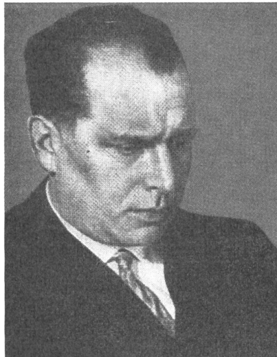
Dr. Julius Leber 16. November 1891–5. Januar 1945