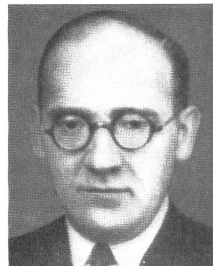
Bernhard Letterhaus 10. Juli 1894–14. November 1944