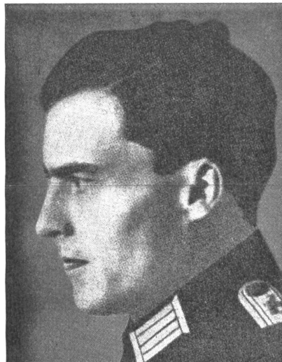
Obert Claus Schenk Graf v. Stauffenberg 15. November 1907–20. Juli 1944