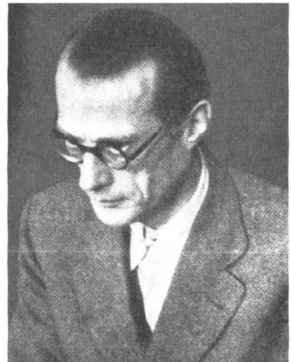
Ulrich-Wilhelm Graf Schwerin von Schwanenfeld 21. Dezember 1902–8. September 1944

Die Geschichte des Widerstandes aber lehrt, welch ungewöhnlichen Grades an geistiger Wachsamkeit und sittlicher Unbeirrbarkeit es bedarf, um das Totalitäre zu durchschauen, ihm zu widerstehen, und daß ein solcher Aufstand der Gewissen zwar weit in die Zukunft strahlt, doch nicht vermag, ein einmal zur Macht gelangtes Terrorregime von innen her zu stürzen.