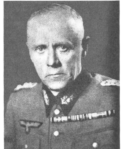
Generaloberst Ludwig Beck 29. Juni 1880–20. Juli 1944