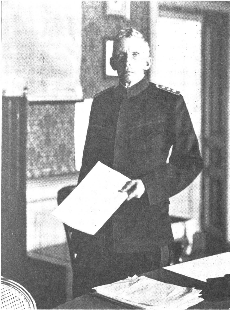
Generalstabchef Th. Sprecher von Bernegg