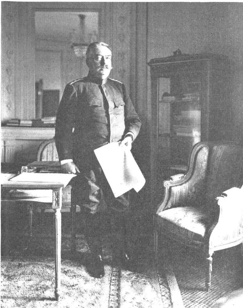
General Ulrich Wille

Manneswesen bedingte vorerst Sicherheit, deren Nährboden die Gründlichkeit ist: Der Milizsoldat durfte sich nicht bequem auf mildernde Umstände berufen. Er hatte