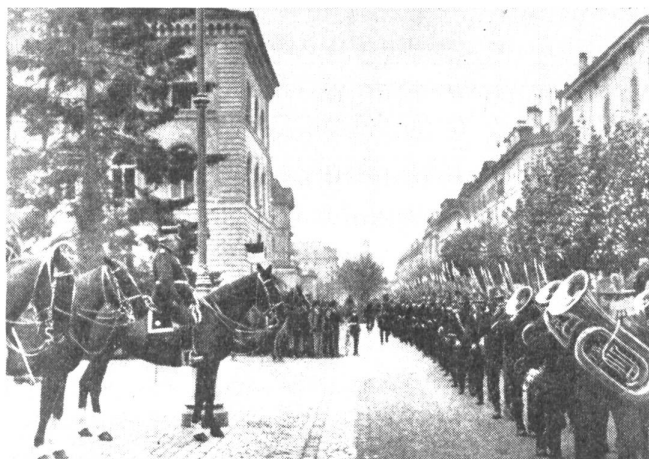
Defilee einer Waadtländer Brigade vor General Wille