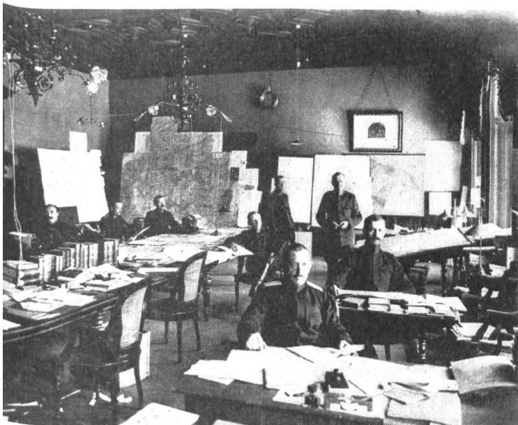
Blick in ein Arbeitszimmer des Armeestabes in Bern

Aus seinem Wesen und als loyaler Mitarbeiter Willes forderte auch er die Disziplin. Mit dem General betonte er, daß gute, richtig befehlende Offiziere und Unteroffiziere, die mit Vernunft das Notwendige verlangen, eine wesentliche Grundlage der Disziplin seien, wobei er ausdrücklich hervorhob, daß es für die Schaffung und Erhaltung der Disziplin notwendig sei, den Unterschied zwischen bürgerlichem und soldatischem Leben nicht zu verwischen, sondern zu betonen. So hieß es im Bericht über den Aktivdienst: «Niemals aber darf Hand zu einer demokratischen Neuerung geboten werden, die irgendwie die Gehorsamspflicht der Untergebenen oder die Verantwortungsfreudigkeit der Vorgesetzten gefährden könnte.» blieb Sprecher in dieser Frage auf der Linie General Willes, brachte es sein Amt mit sich, daß er sich auch mit Fragen der Verwaltung und der technischen Kriegsbereitschaft beschäftigte. Was er 1896 schrieb, gehörte immer zu seiner Grundüberzeugung: «Die Zentralisation mit ihrer Schutztruppe, der Bürokratie, ist überall und zu allen Zeiten der schlimmste Feind der wahren Freiheit gewesen. Es führt die Vermehrung der Kompetenzen des Bundes in Verbindung mit dem Anwachsen seiner Mittel schließlich zu einer Machtansammlung in den Händen des Bundesrates