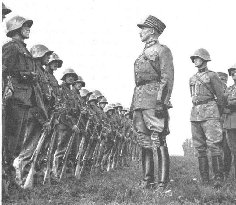
General Guisan inspiziert eine Einheit

«Soldaten! Am 1. August 1940 werdet ihr euch vor Augen halten, daß die neuen Stellungen, die ich euch zugewiesen habe, diejenigen sind, wo eure Waffen und euer Mut sich