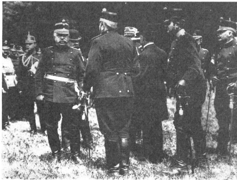
Manöverkritik in Anwesenheit des Bundesrats. Links General Wille, hinter ihm Bundesrat Décoppet, mit dem Rücken zur Kamera Bundesrat Motta.