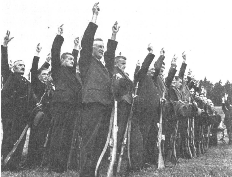
Vereidigung einer Ortswehr irgendwo in der Schweiz

Wille, Guisan, von Sprecher und Huber sind unbequeme Mahner. Mögen sie unser Gewissen immer wieder aufstören und uns durch ihre Vorbildlichkeit anfeuern, damit wir auch heute das Gemäße tun und ihr Dienen nicht umsonst gewesen sei.