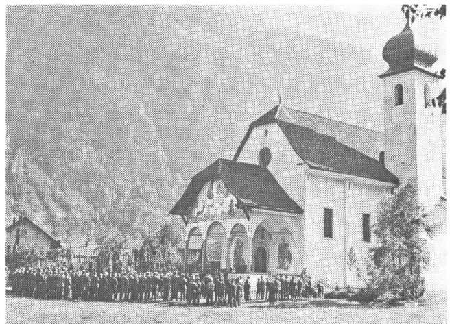
Prächtige Kulisse für den Festgottesdienst; das Marienheiligtum Jagdmatt, Erstfeld