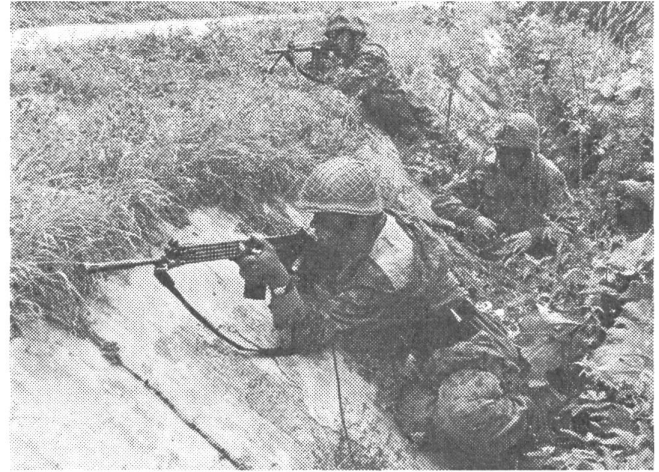
Infanterist mit Sturmgewehr

Wenn also mit 1. Januar 1963 die neue Gliederung in Kraft getreten ist, ist dies, wie uns versichert wurde, nur ein neuer Schritt zur Erhöhung der Schlagkraft des Bundes-