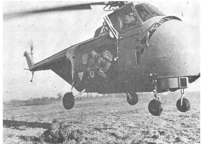
Infanterie-Einsatz vom Helikopter aus