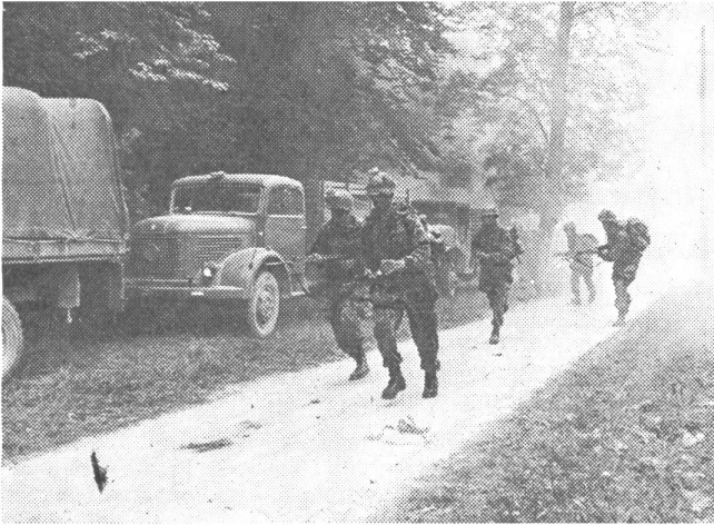
Kampfgruppe greift stehende Transportkolonne an

andere Truppe auch nur annähernd so differenziertes Material zur Verwendung im Kampf hat. Das Wesensmerkmal, der Kampf zu Fuß, blieb bisher trotz Motorisierung erhalten, denn das Element des Infanteristen ist der vordere Kampfschauplatz, und dort kämpft er mit der Waffe, die er selbst führt und bedient.