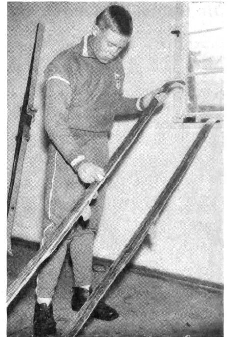
7 Mitentscheidend für den Erfolg ist auch der richtige Griff in die Wachskiste. Die verschiedenen Schichten werden sorgfältig aufgetragen, wobei die Laufsohle zuletzt am frühen Morgen genau nach der Beschaffenheit der Loipe präpariert wird, mit Rücksicht auf die Schneebeschaffenheit, die Aufstiege und Abfahrten.